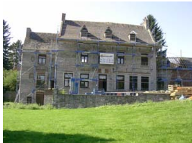
Monsieur l' ancien presbytère