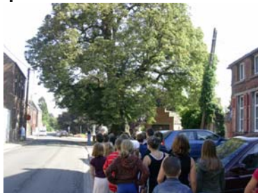
Monsieur le tilleul de l'Espinette ( planté en 1752)