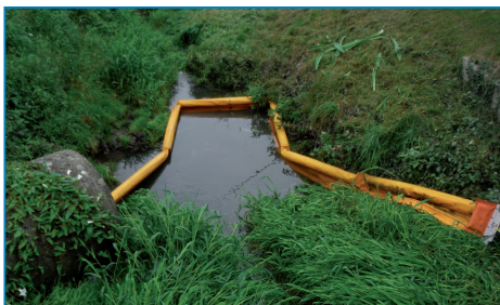
Barrage flottant sur la Sennette à Familleureux

panneaux didactiques pour une opération contre les OFNI's (Objets flottants non identifiés). Dans le cadre des « journées wallonnes de l'eau » du 20 au 30 mars 2014, la Commune de Seneffe a organisé diverses actions autour de cette thématique. Le samedi 22 mars, une matinée à la