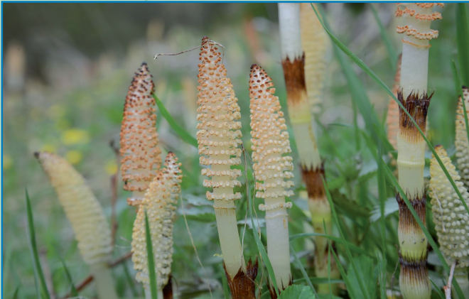
Gros plan sur des prêles, le long de l'ancien canal

Nouveauté... la traditionnelle distribution de l'arbre sera suivie par une balade guidée ! A 13h30, nous partirons du service des Travaux, direction le château de Seneffe et ensuite le tunnel de Godarville, en compagnie d'Eric Jenet qui, avec ses diverses casquettes associatives... La Malogne, la Maison de la Mémoire et l'Office du