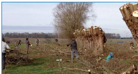
Chantier de taille des saules têtards à Bois des Nauwes

Fin février, un chantier de gestion (taille et entretien de saules têtards dans l'entité) avec distribution de plaçons a été réalisé en collaboration avec l'asbl Noctua sur un terrain au Bois des Nauwes. Le bois a été laissé au propriétaire, les plançons distribués aux bénévoles intéressés, les petites branches broyées par le Service des Travaux.