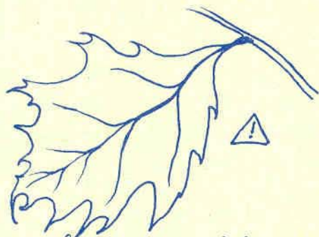
du chêne rouge d'Amérique

Un seul regret... parmi les arbres offerts par la Région Wallonne se trouvaient des chênes rouges d'Amérique, espèce non indigène... mais tolérée par la Région lors de subvention de plantations de haies.