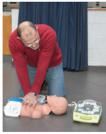
formation organisée par la commune en 2016.

La Commune de Seneffe a à cœur de faire en sorte que ces défibrillateurs soient de plus en plus accessibles dans les espaces publics et de sensibiliser les citoyens à leur importance. Elle prévoit également d'organiser de nouvelles formations à la bonne utilisation de ceux-ci. Elle tient également à remercier les personnes qui ont porté secours au jeune homme, et qui lui ont ainsi sauvé la vie.